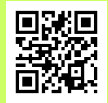
ホームページQRコード